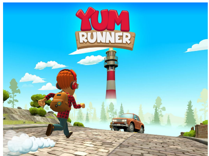
Bazookas project: Yum runner

Het kan gaan van speelse bewustmaking tot een permanente leeromgeving, zoals het leerplatform Bingel voor de lagere school. Zo leert de Yum Runner kinderen spelenderwijs de voordelen van gezonde voeding en beweging.